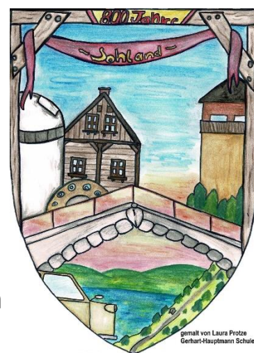
800 Jahrfeier Sohland Festwoche 26.05. - 29.05.2022

800 Jahre Sohland sind ein ganzes Stück bewegte Orts- und auch Kirchen-geschichte, und ein Grund mehr, Gott zu danken für seine Treue und Güte, und ihn zu bitten, um Frieden und Gedeihen wie auch um eine Neubesinnung der Menschen auf ihn, den Geber aller guten Gaben. Unser Gottesdienst am Himmelfahrtstag steht diesmal im Zeichen dieses Jubiläums und wir feiern ihn als ökumenischen Gottesdienst, gemeinsam mit den Geschwistern aus der katholischen Kirche und der Freikirche Sohland. 10.00 Uhr im Festzelt auf dem Schützenplatz in Sohland. Am Sonntag, dem 29. Mai , werden die drei Kirchen – evangelisch, katholisch, freikirchlich – auch mit einem gemeinsamen Wagen beim Festumzug vertreten sein, um gemeinsam Gott die Ehre zu geben und ein Zeichen zu setzen, dass wir uns in Jesus verbunden und zum Dienst an den Menschen gerufen wissen. Der erste Vorbereitungstreff dafür ist am Dienstag, den 3. Mai, um 20.00 Uhr im Pfarrhaus in Sohland. Leute, die mitmachen, sind gerne willkommen.